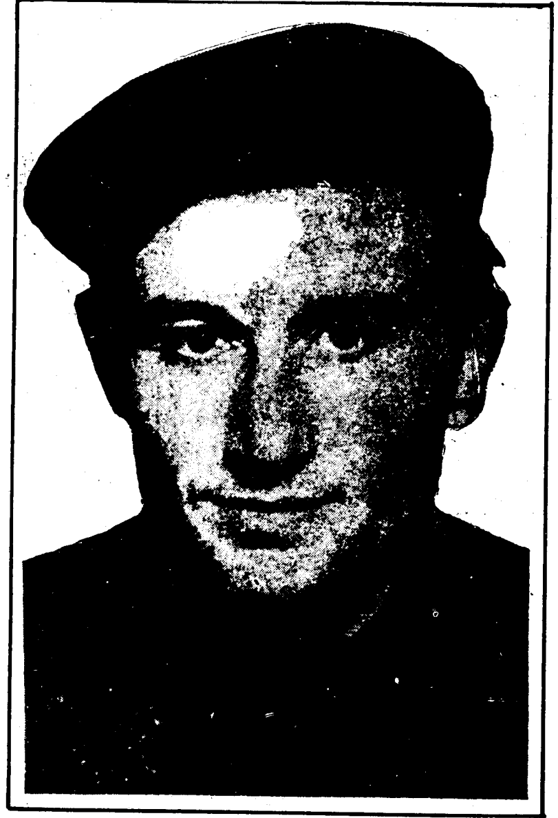
İBRAHİM KAYPAKKAYA (1949 - 1973)